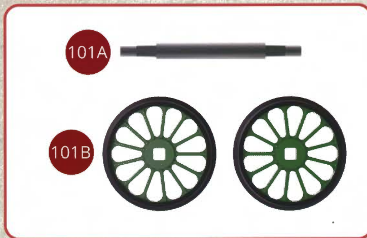
Assemblage d'un essieu monté