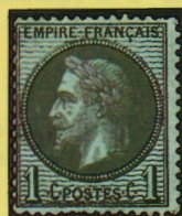
vert-olive foncé sur verdâtre