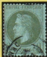
vert-olive clair sur bleuté