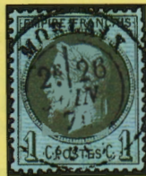
vert-olive sur bleu

Malgré la dénomination officielle, vert-olive sur papier bleuté, les tirages successifs ont entraîné des variations de couleurs: de l'olive terne au vert-olive pour le dessin, de l'azuré au verdâtre en passant par le bleu franc pour le papier.