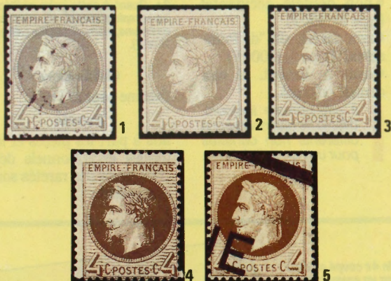
Un aperçu des diverses tonalités du 4c (1-4). Très différente, la couleur dite "mordoré" (5).

L'administration, poétique, avait attribué à la couleur officielle le nom de gris perle. En fait, de nombreuses variations sont possibles : gris plus ou moins foncé, plus ou moins vif.