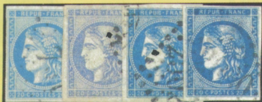
bleu outremer bleu foncé bleu très foncé