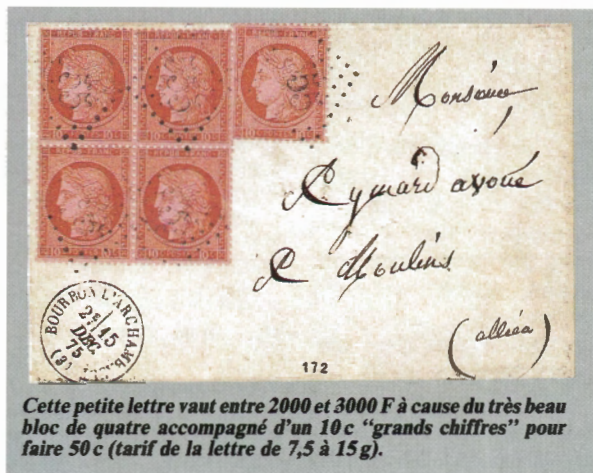
Cette petite lettre vaut entre 2000 et 3000 F à cause du très beau bloc de quatre accompagné d'un 10 c "gros chiffres" pour faire 50 c (tarif de la lettre de 7,5 à 15 g).

De plus, leurs prix modiques permettent de faire un choix rigoureux en sélectionnant des timbres exempts de tous défauts. N'hésitez pas non plus à acquérir les paires, bandes et blocs que vous verriez passer, ils ne sont pas très courants sur ces petites valeurs.