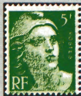
Impression très brouillée du 5 F vert jaune (25 F).

● Impression : les tirages effectués à la va-vite sur papiers d'assez mauvaise qualité ont causé de nombreux défauts: impressions oscillées (6 F), lourdes, encrassées (8 F), défectueuses (15 F), fonds lignés