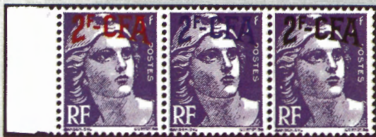
Essais de surcharge (1000 F) : la couleur noire a été retenue.

● Nuances : la plus recherchée, le mauve foncé (5 F). Attention aux "fausses" nuances : l'encre de certains tirages est