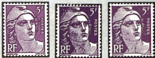
Nuances, de gauche à droite : le 5 F normal, le violet foncé et le violet gris.

soluble dans l'eau et donne au timbre une apparence brunâtre qui n'est pas une variété de couleur.